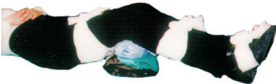
Fot 1. Prawidłowe wykonanie unieruchomienia kończyny dolnej