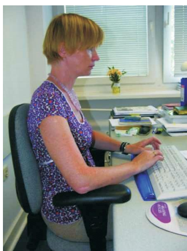
Rys. 3. Prawidłowa pozycja przy pracy z komputerem odciążająca odcinek lędźwiowy kręgosłupa