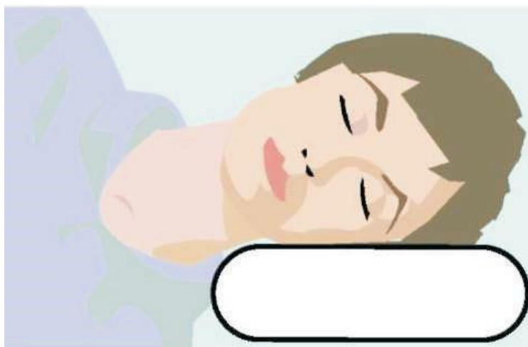
Rys. 4. Prawidłowe ułożenie głowy

Łóżko powinno zapewniać możliwość prawidłowego leżenia na plecach, na boku lub na brzuchu tzn. w sposób pozwalający na skuteczne odciążenie całego kręgosłupa. Dzieci zawsze powinny spać na sztywnym i płaskim podłożu. Poduszka nie powinna być zbyt miękka, a głowa nie powinna się w nią zbyt zapadać. Bardzo zalecane są poduszki, które można kupić w sklepach ze sprzętem rehabilitacyjnym. Odpowiednie są również zwarte, nieco grubsze poduszki z owczej wełny. Dobra poduszka powinna zapewniać należyte podtrzymanie głowy również przy ułożeniu na boku tak, aby głowa z niej nie zwisała, lecz była utrzymywana na przedłużeniu linii kręgosłupa. Poduszka powinna wypełniać niemal cały kąt pomiędzy szyją a barkiem.