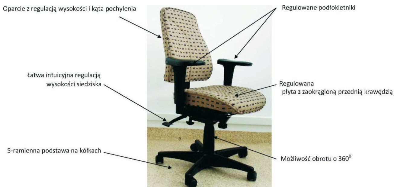
Rys. 2. Krzesło spełniające wymogi ergonomii

Biurko wraz z odpowiednim krzesłem to podstawowe wyposażenie pokoju ucznia. Powinny być one dostosowane do wzrostu dziecka. Najlepsze jest krzesło z regulowanym siedziskiem i oparciem. Wysokość siedziska powinna być indywidualnie dopasowana tak, aby dół podkolanowy i znajdujące się tam naczynia krwionośne, nerwy i ścięgna nie były uciskane krawędzią przedniej płyty siedziska. Główny punkt podparcia pleców przez krzesło powinien znajdować się w okolicy odcinka lędźwiowego kręgosłupa.