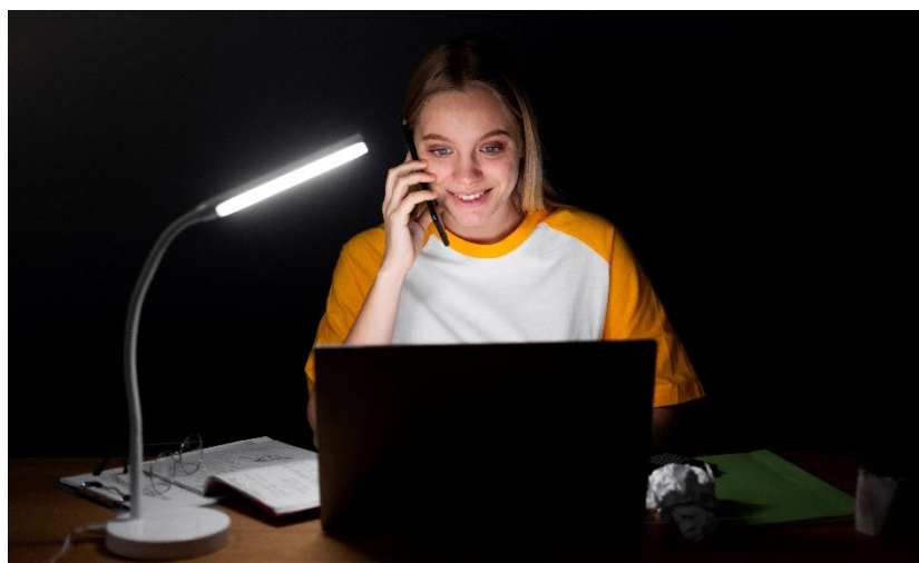
Rys. 1. Przykład oprawy oświetlenia miejscowego przeznaczonej do oświetlania stanowiska pracy z komputerem

Należy ograniczyć olśnienie bezpośrednie od opraw, okien, przezroczystych lub półprzezroczystych ścian albo jasnych płaszczyzn pomieszczenia oraz olśnienie odbiciowe od ekranu monitora, w szczególności przez stosowanie odpowiednich opraw oświetleniowych, instalowanie żaluzji lub zasłon w oknach.