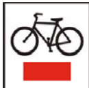
R-1 szlak rowerowy krajowy