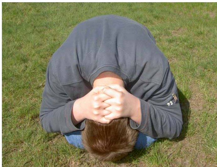
Pozycja żółwia przodem