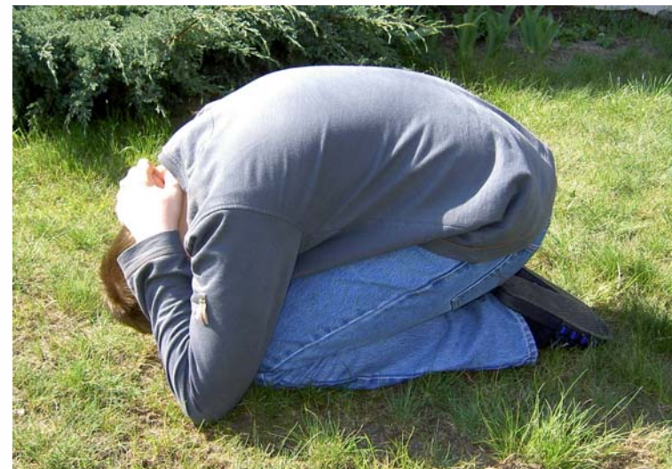
Pozycja żółwia bokiem